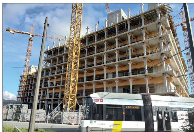
P&R Luchtbal (Antwerpse Bouwwerken NV)