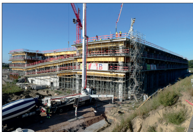
P&R Blancefloerlaan (THV Civiel Linkeroever)

Uitdaging voor onze afdeling engineering is deze verscheidenheid aan vloertypen te voorzien van een geschikte ondersteuningsconstructie, dit met de wetenschap dat de ondersteuningshoogtes variëren van 1 meter tot 8 meter, inclusief rekenkundige onderbouwing. Puzzelen voor gevorderden!